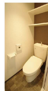
▲収納付置コーナーユニットで大収納空間が生まれました。