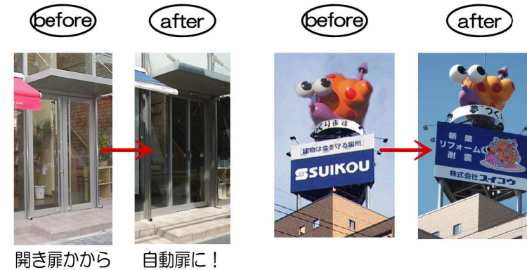
開き扉から 自動扉に!