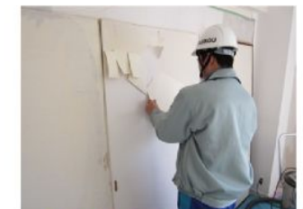
▲壁紙をはがす作業を体験中

早朝(7:00)の集合時刻に遅刻することなく、生徒達は一生懸命頑張りました。 今後も地域の子どもの成長に寄与するべく、微力ではありますが弊社も協力して参ります。