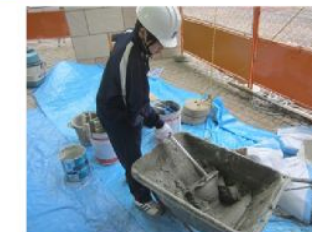
▲モルタルの練り作業を体験中