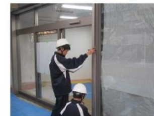
▲コーキング材の充填準備作業を体験中

●生徒達の感想● 「大工さんの素早い動きに感動した」 「朝早くから始まる仕事で、ちょっと大変だった」