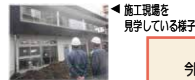
◀ 施工現場を見学している様子。