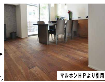
アッシュ 床暖房対応 無垢フローリング 120mm巾