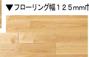
▼フローリング幅125mm巾