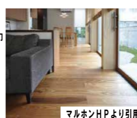
マルホンHPより引用