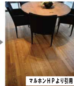
マルホンHPより引用 6年後