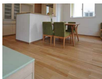
タモ 床暖房対応 無垢フローリング 75mm巾。

無垢木材は乾燥や熱によって動きが生じるため、床暖房には対応できないというのが業界の常識でしたが、現在では、通常のフローリングとは異なった加工や乾燥工程を経ることで寸法安定法を高め、床暖房に対応した無垢フローリングが増えてきています。