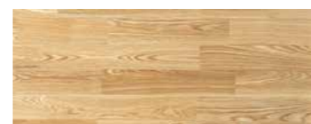
▲フローリング幅90mm巾

フローリングは幅によって部屋の見え方も変わります。平均的なフローリングの幅は75~90mmが目安です。ものによっては125mmもあり、幅が広いと広々とした空間が広がり、落ち着いて見えます。