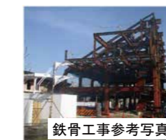
鉄骨工事参考写真